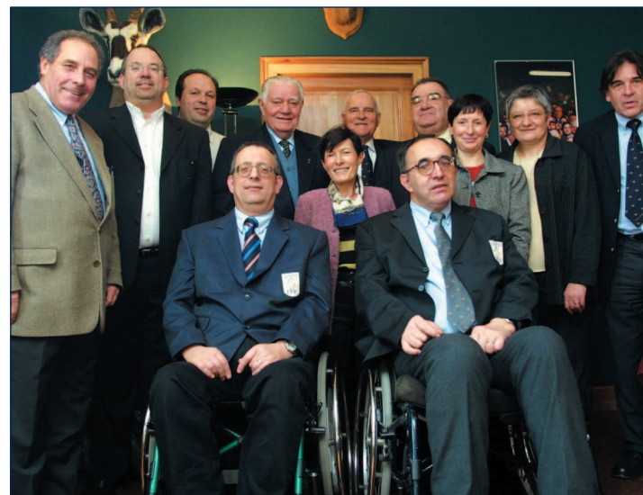
La Commission Solidarité lors d'une de ses trois réunions annuelles à Agen.